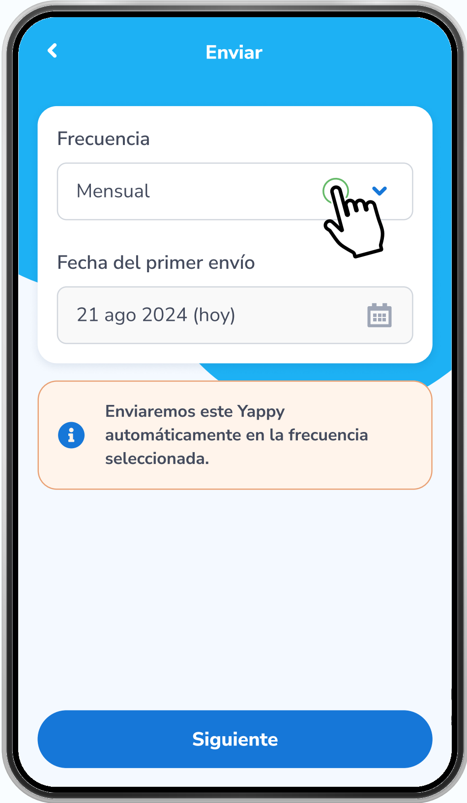
Pago a comercio